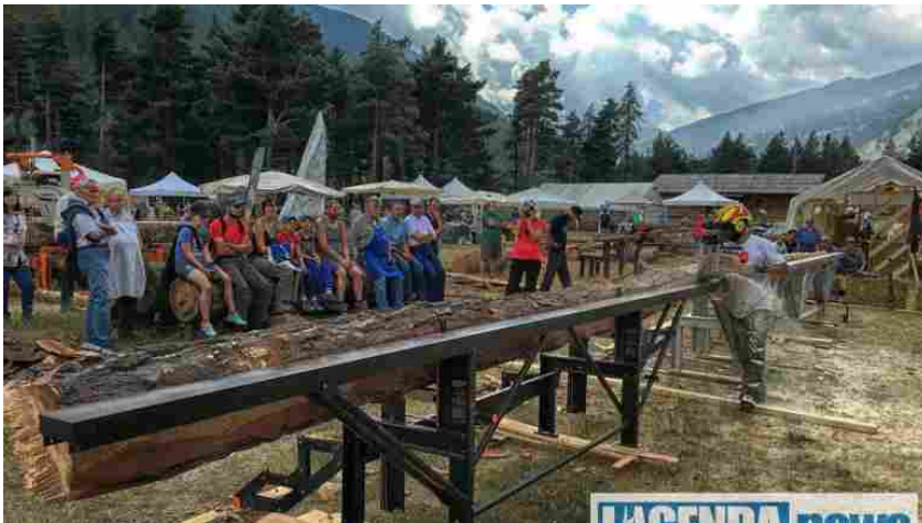
Legni in Valle a Usseaux

La manifestazione è dedicata alla promozione e valorizzazione della filiera legno nelle vallate alpine quale elemento di economia e urbanistica