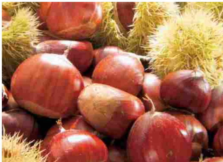
Immagine di repertorio

Iniziative a livello regionale, grazie ad una serie di soggetti istituzionali